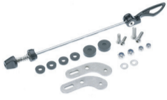
Für Montage des HR-Trägers am Ausfallende ohne Ösen. Schnellspanner-Adapter HR-Träger Art. 71500