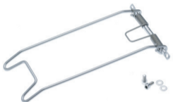
Federklappe Cargo Edelstahl Art. 70014 oder Art. 70017 für Looco oder Art. 70023 für Logo