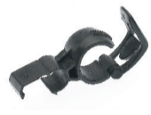
Pumpenhalter Art. 60007