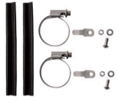
LM-BF Montageset für Gabeln ohne Ösen Art. 72200