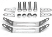
Schellen-Adapterset Art. 71614 / Art. 71616 Art. 71618 / Art. 71621 Art. 71624