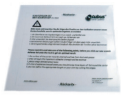
Schutzfolien-Set Art. 79005