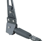
Ständer für Lowrider mit Adapterplatte Art. 73000

(Für Farben und weitere Details besuchen Sie unsere Webseite: tubus.com )