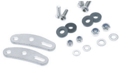
Fussverlängerung Hinterradträger Art. 70024