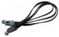
Spanngurt 3-fach „tubus“ Art. 75050